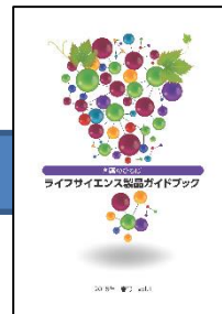
ガイドブック 創薬のひろば