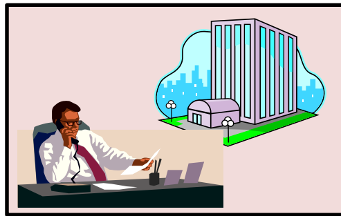
ライフサイエンス企業様