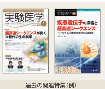
過去の関連特集(例)

今後は、スマートフォン接続型のデバイスの登場まで予定されており、まさに「アイデア次第で何でも定量」時代の足音が聞こえてきています。今回の特集では、ナノポア・シークエンサーのearly-adaptorに集結いただき、現状と夢を大いに語っていただきます。生態学研究から臨床診断まで、見逃せない話題が目白押しです。