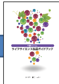
ガイドブック 創薬のひろば